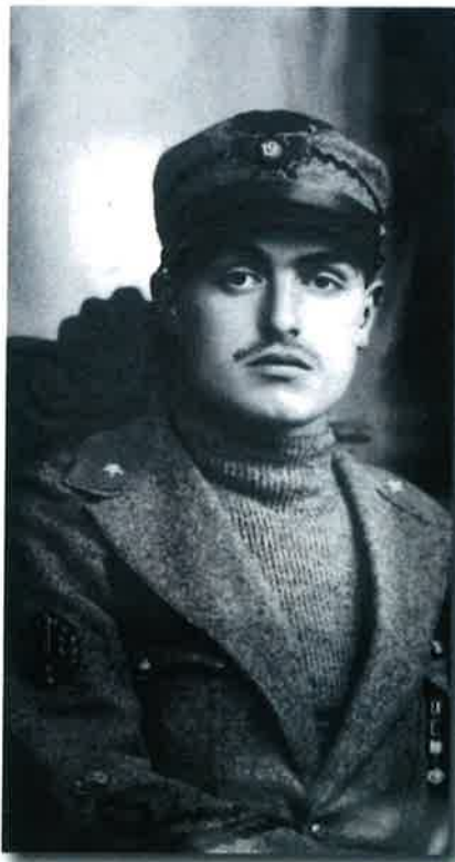
L' Aiutante di Battaglia Soccorso Saloni

La sede della Scuola è dedicata alla memoria dell'Aiutante di Battaglia Soccorso Saloni, pluridecorato e Medaglia d'Oro al Valor Militare alla Memoria.